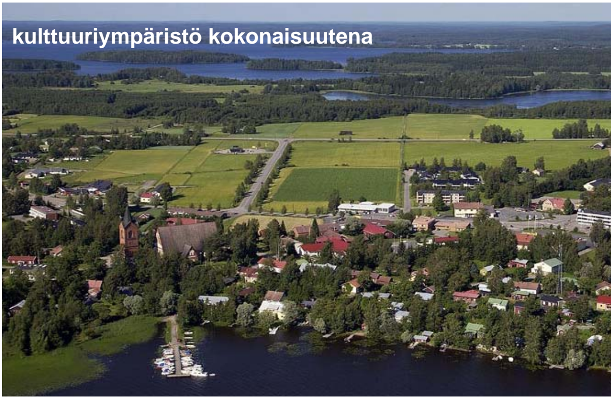
Kuva 1. Kulttuuriympäristö ja sen osat.