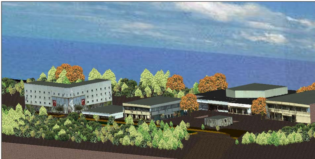
Kuva 2. 3D-malli, jossa rakennuksilla on tekstuurit. (Tunc et. al. 2004)